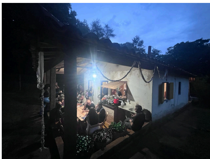
Legenda: Café e momento de integração Autoria: Eduardo Santos Data: 01/03/2024